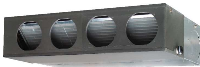
Taille 18G à 30G