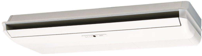
Taille 18P à 36P Plafonnier