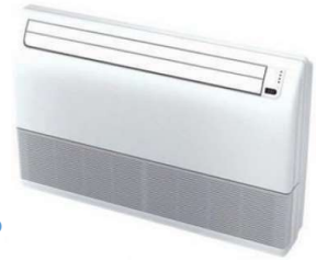
Taille 12AP Allège Plafonnier